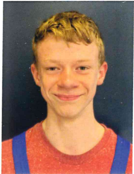
Felix Kegebein FK für Metalltechnik